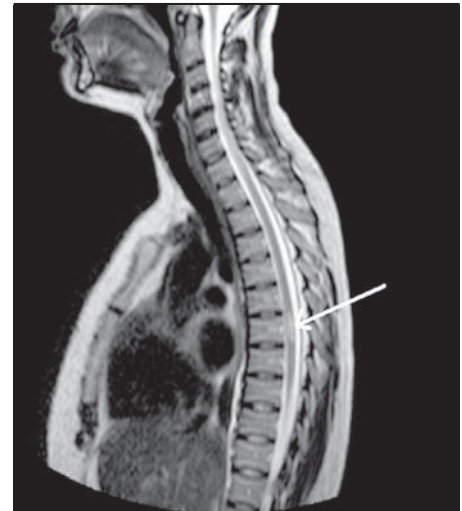
Obrázek 2. MRI zobrazení ložiska RS v míše

v České republice registrován a je po pečlivém zvážení možných rizik k dispozici pro indikované pacienty s aktivní RS.